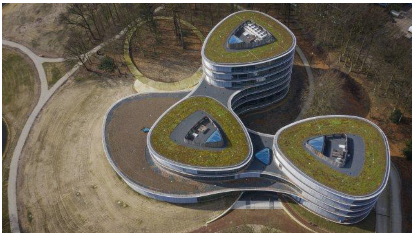
Le siège de la banque Triodos, à Zeist, aux Pays-Bas.